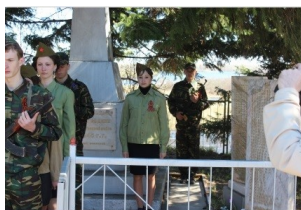
Томская область, Колпашевский район, село Инкино