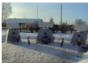
Томская область, Колпашевский район, село Инкино

Теперь их можно увидеть на Карте Памяти.